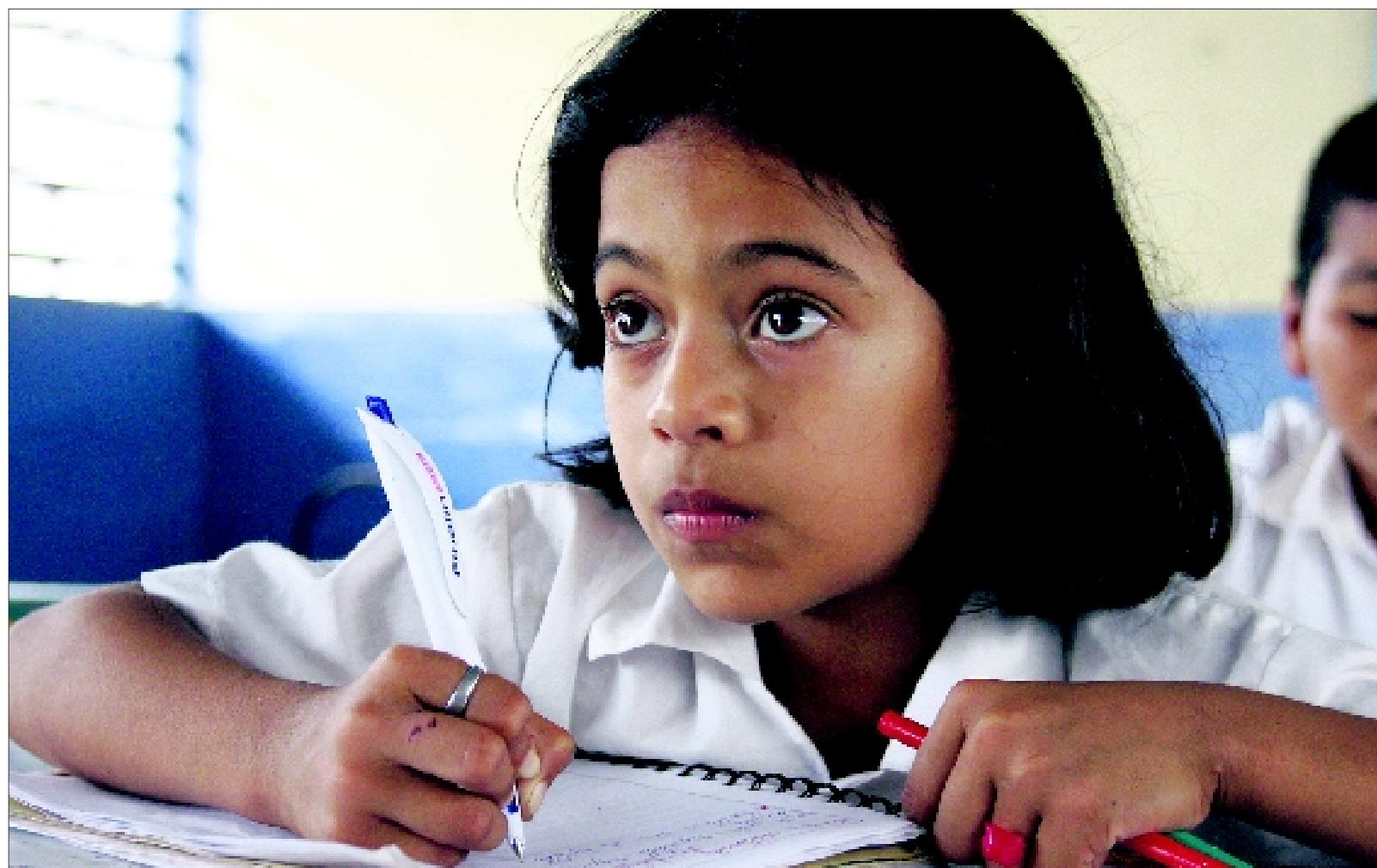
Eine Schülerin der vierten Klasse der Grundschule in Guayaquil.

Für Flor sind die Unterschiede noch größer. Ohne das Internat der Schule wäre es ihr gar nicht möglich, auf eine weiterführende Schule zu gehen. Wenn sie ihre Familie besucht, ist sie über drei Stunden im Bus auf Schotterstraßen unterwegs. Kurz bevor der Bus das Dorf erreicht, steht sie auf, der Bus verlangsamt leicht, sie springt ab und läuft einen Hügel hinauf zur Hütte ihrer Familie. Die Wohnhütte steht auf Stelzen, eine zweite kleinere, ebenerdige Hütte mit Feuerstelle am Boden ist die Küche.